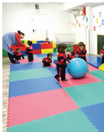
Les instal·lacions d'Anca